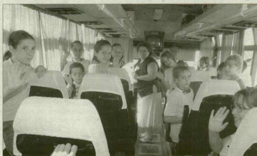
A fürdősen kívül kirándulásra készülnek a gyerekek.