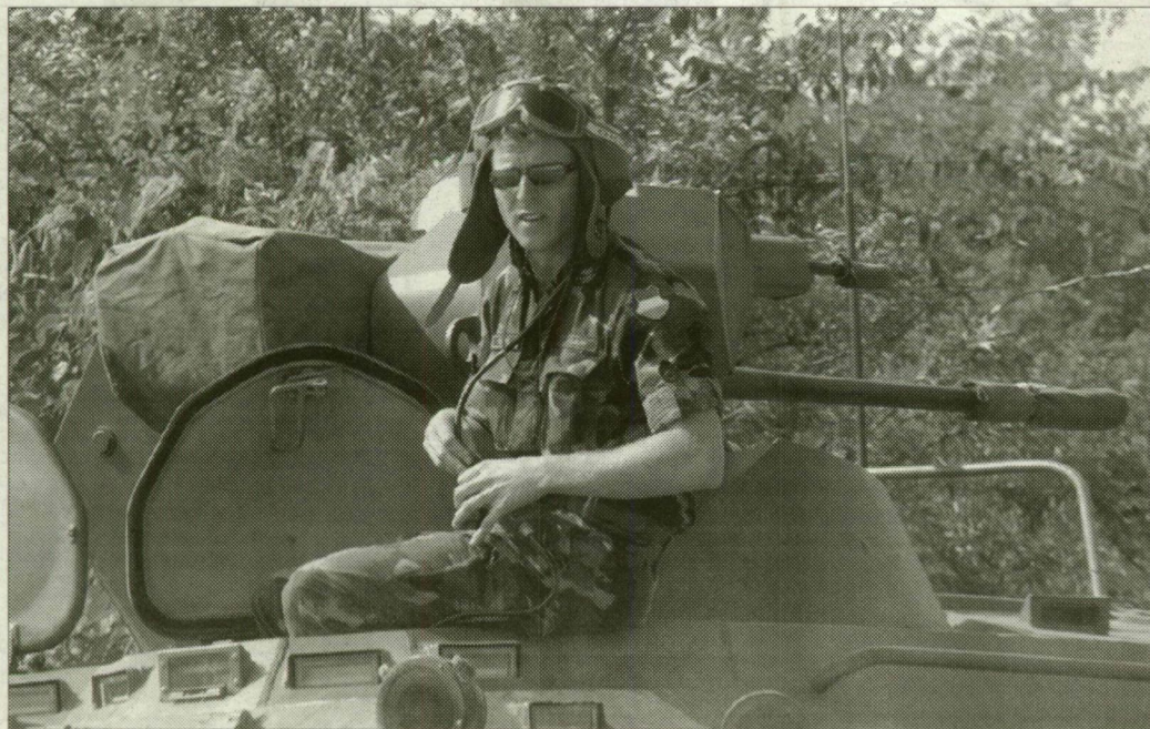
A békefenntartó katona békésebb pillanata. Levegőzni muszáj.