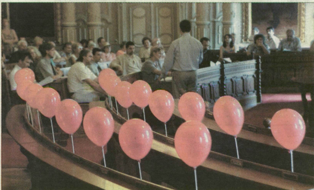
Munkában a Fidesz-frakció. A szocialisták helyére piros lufikat tettek.

Mint ismert, a szegedi közgyűlés Fidesz-MPSZ frakciója július 30-án rendkívüli közgyűlés összehívását kezdeményezte három témában. A fideszes képviselők szerint a hatályos szabályok értelmében a polgármesternek tegnapra össze kellett volna hívnia a rendkívüli közgyűlést. A városvezetés azonban szintén a hatályos szabályokra hivatkozva hiánypótlásra kérte fel a Fidesz-frakciót, s a rendkívüli ülésre javasolt napirendekhez előterjesztéseket is kért. Ezeket az elmúlt csütörtökön nyújtotta be a Fidesz képviselőcsoportja. Botka László augusztus 22-ére összehívta az ellenzék-kezdeményezte rendkívüli közgyűlést, s ugyanerre a napra a rendes közgyűlést is. A fideszes képviselők az álta-