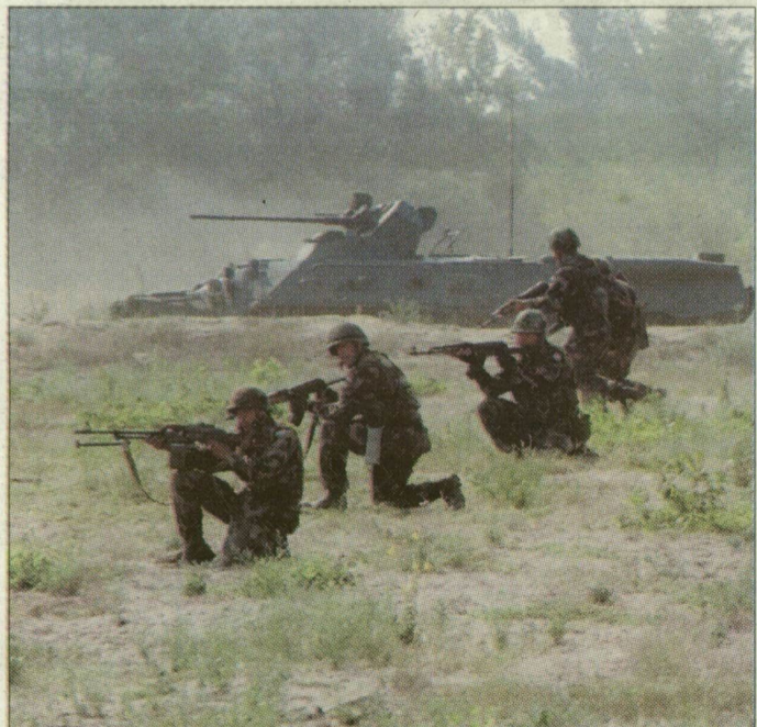
A vásárhelyi Bercsényi Miklós Gépesített Lövészdzandár tartott tegnap békefenntartói lögyakorlatot a dóci lőtérén. A magyar-román közös zászlóalj magyar katonáinak ezúttal speciális célokra kellett tüzelniük. Frásunk az 5. oldalon.