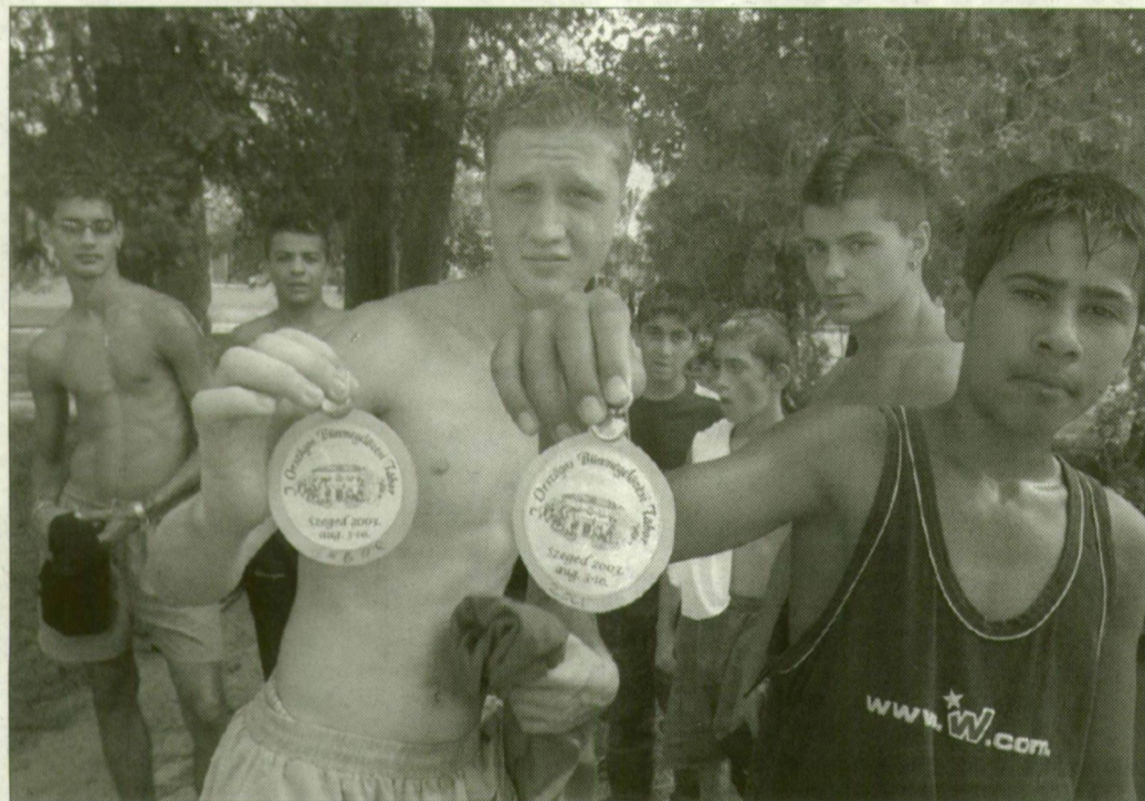
Néhány elégedett táborlakó.