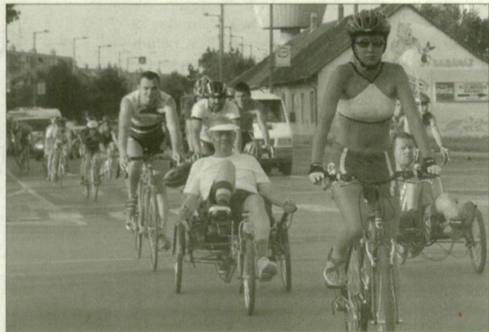
Túrások a Rókusi körúton.