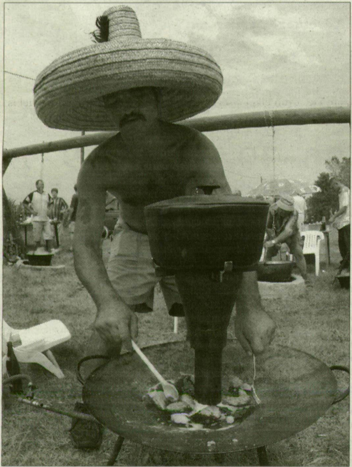
A sütő-főző emberek is bemutatták tudásukat a tanyán élők első fesztiválján.