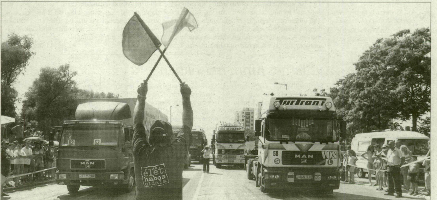
Tonnák párharca. Fűlsiketítő zaj kísérte a kamionok gyorsulási versenyét.

A Sziklin szombaton rendezték meg a kamionos terep-, illetve szépségversenyét. A homokos talajjal a volt keleti blokk országaitak gyártott gépek könnyebben megbirkóztak, mint nyugati társaik. Az amerikai Freightliner pedig megérdemelten kapta meg a találkozó legfeltűnőbb gépe címet. A csőrös, 500 lóerős kamion mellett eltörpültek a Mercedesek, az Ivecek és az IFA-k.