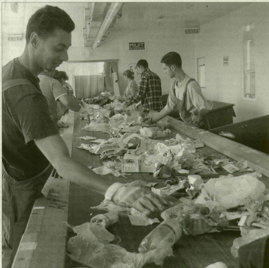
Az otthon külön gyűjtött szemetet a Sándorfalvi úti üzemből válogatják tovább.

„A szeméttengeren innen, az üveghegyen túl...” – kezdődhetne a csarnokról szóló történet, hiszen az üzem az üveghegyről rakott csillogó domb, és a sárlayok vijjogásától hangos depó világ-