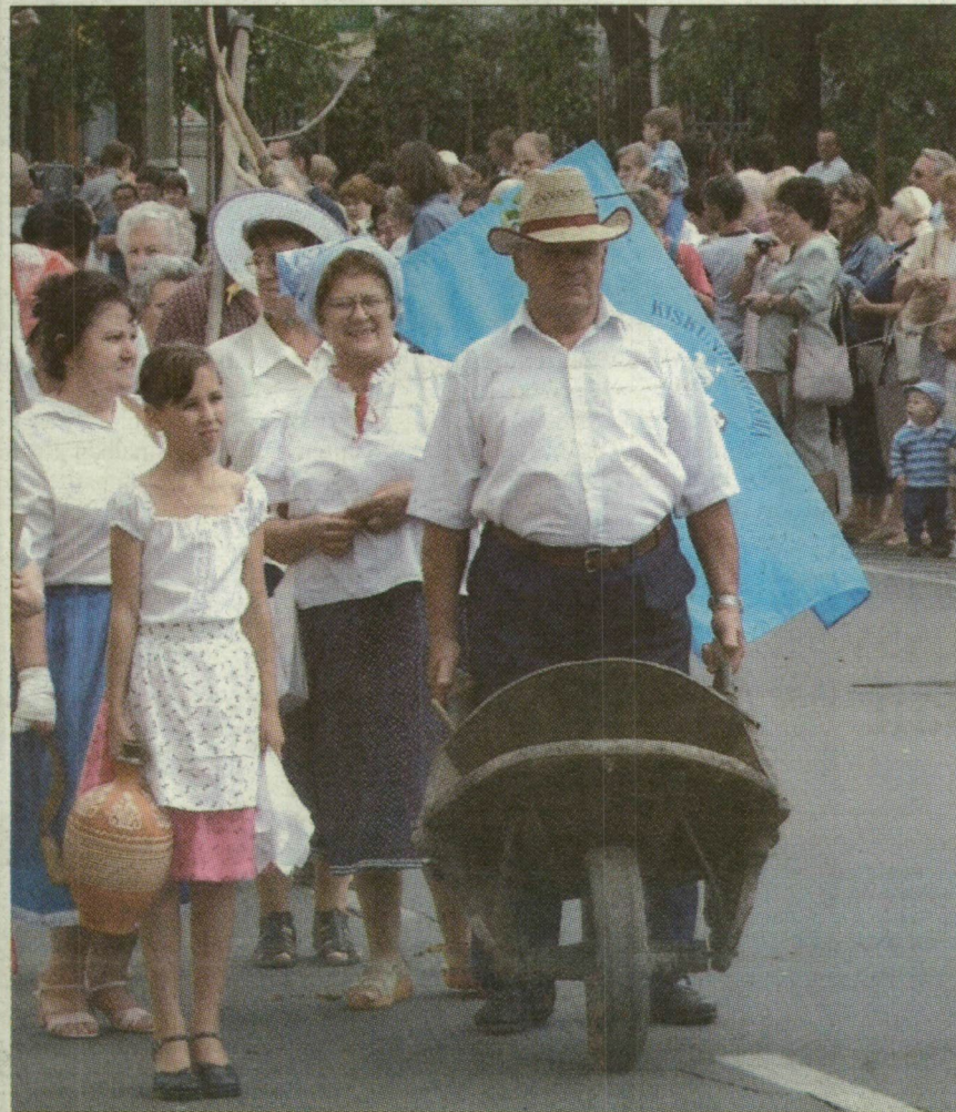
A kiskundorozsmaiak és a szőregiek karneváli csoportja a szegedi Széchenyi téren.