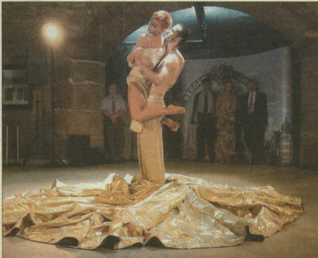
A Szegedi Kortárs Balett táncosai a Carmina Buranából mutattak be egy részletet.

A megyében öten már megállapodtak a földalapekezelővel