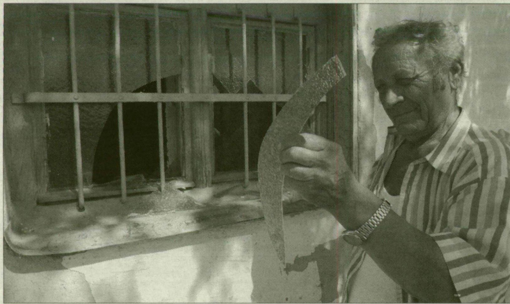
Az egyik ablaktábla szabályos félkör ívből készült.