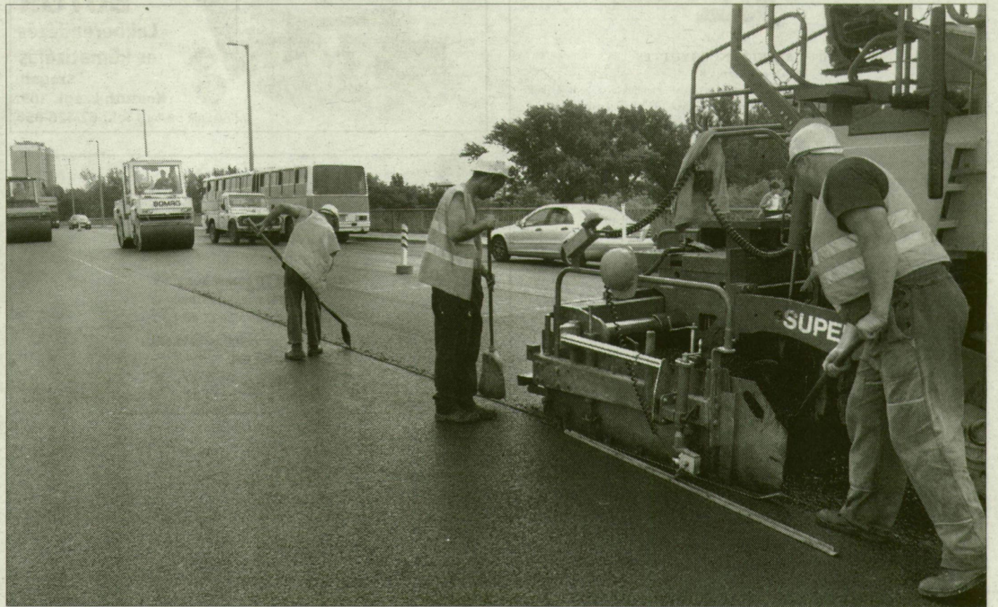
Utolsó simítások az aszfaltszönyegen.