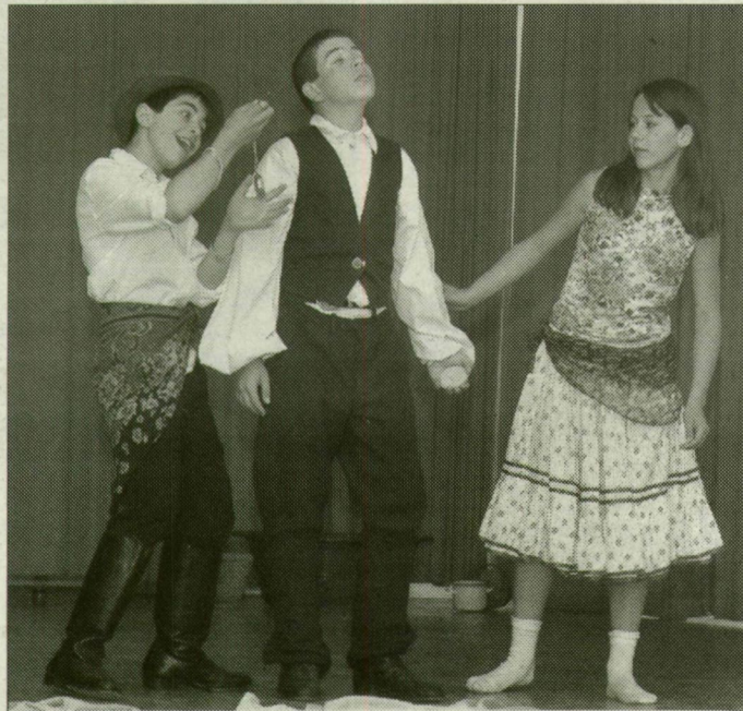
KURCA FÁTYLA GYERMEKSZÍNJÁTSZÓ TALÁLKOZÓ

Távoli városokból is érkeztek Szentesre.