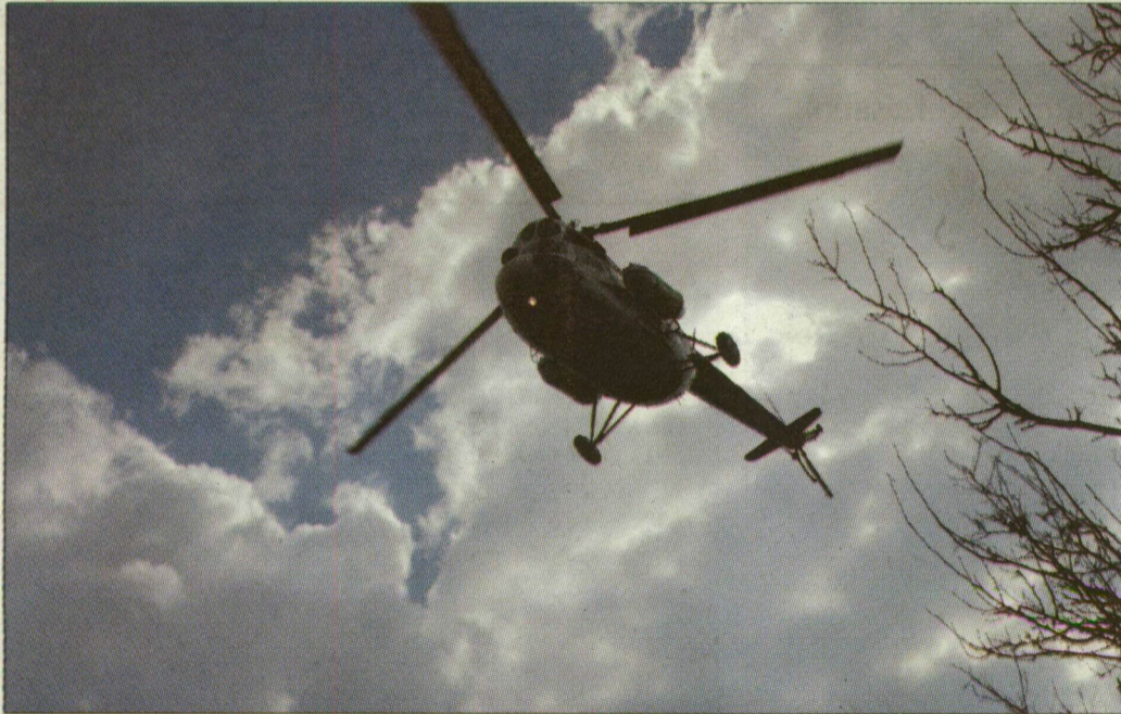
A szegedi helikopter Siófokon járt, ám nem vetették be.