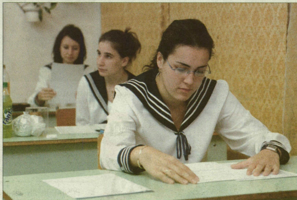
A középiskolásoknak, gimnazistáknak is fontos változásokra lehet számítaniuk.

- Nyugodtan mondhatom, pénzügyileg és szakmailag is előkészített a törvénymódosítás, így a kivitelezés sem vihet el nagyobb energiákat tőlünk, mint az előkészítés. S ha már a pénzügyeket említettük. A közoktatási stratégia kialakításában is számoltunk a költségekkel és jelentős uniós pénzeket is remélünk felhasználni a Nemzeti Fejlesztési Tervhez kapcsolódva, biztosított lesz tehát a háttér.