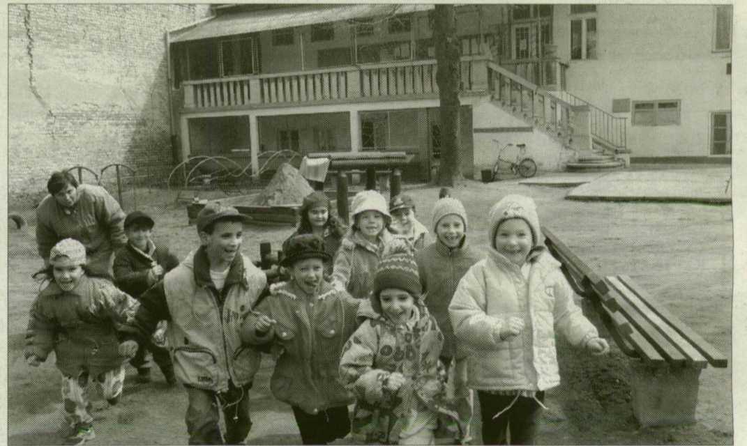
Idilli környezet. Szép, tágas udvarban játszhatnak a gyermekek.

Három óvoda, köztük a Bem utcai gyermekkert bezárását tervezi a szegei önkormányzat. Ennek oka: a költségek csökkentése. A Bem utcai óvodába negyvenkét gyermek jár, az intézmény százsázalékosan kihasznál.