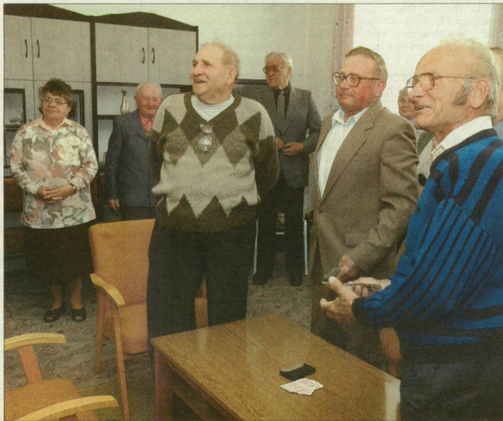
A bordányi Nefejejcs nyugdíjasklub tagjai várják a miniszterelnököt.

A kormányfő mintegy fél órát töltött Bordányban, majd elindult Szegedre. Az előzetes programjában nem szerepelt ugyan, de pár percre felkereste a Sás utcai óvodát, ahol megnézte Macskássy Izolda képeiből tegnap nyílt jótékonyági kiállítást.