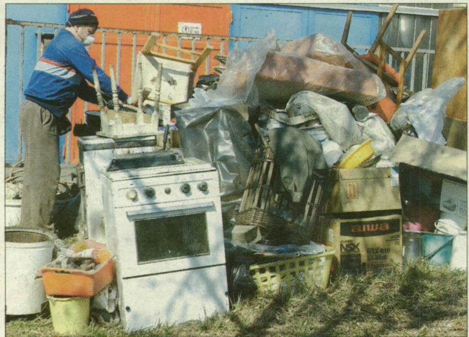
Berendezési tárgyak a szabad ég alatt egy szegedi kilakoltatás után.