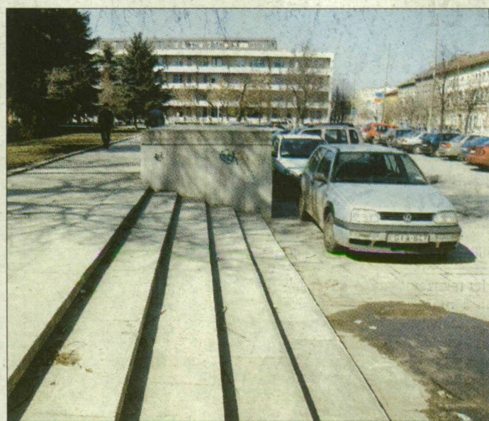
Nagy Imre szobrára vár a Rákóczi tér.