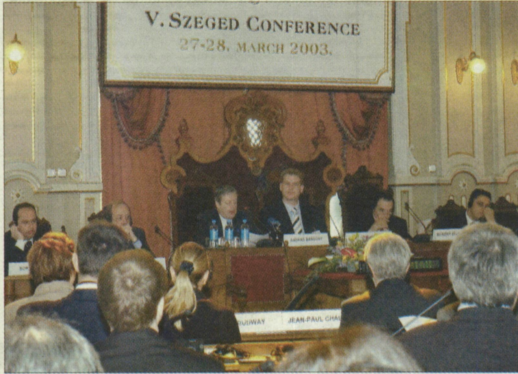
Az előjövő lehetőségeket mérlegették a konferencia résztvevői.

Robert Zeldenrust, a stabilitási paktum munkacsoportjának igazgatója úgy vélte, a határokon átnyúló együttműködés mellett