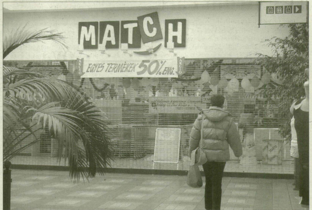
Bizonytalan ideig még zárva tart a Match a Szeged Plazában.