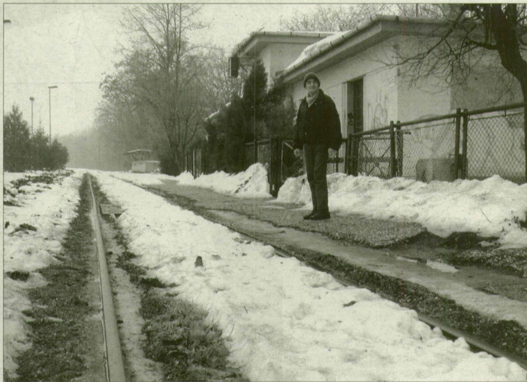
Március végére várható, hogy a vonatpótló buszok helyett újra vasúton közlekedő szerelvények szállíthatják az utasokat Újszeged és Mezőhegyes között.

Közel ötszáz aláírás gyűlt össze néhány nap alatt Makón és térségében az Újszeged-Mezőhegyes közötti vasúti szárnyvonal megmaradása érdekében. Az itt élők attól félnek, a vasúti közlekedés felfüggesztése csupán előjátéka a későbbi végleges megszüntetésnek.