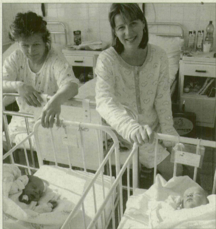
A születésnél a legfontosabb szempont: a gyerek és az anyja is egészséges legyen. (Képzék illusztráció.)