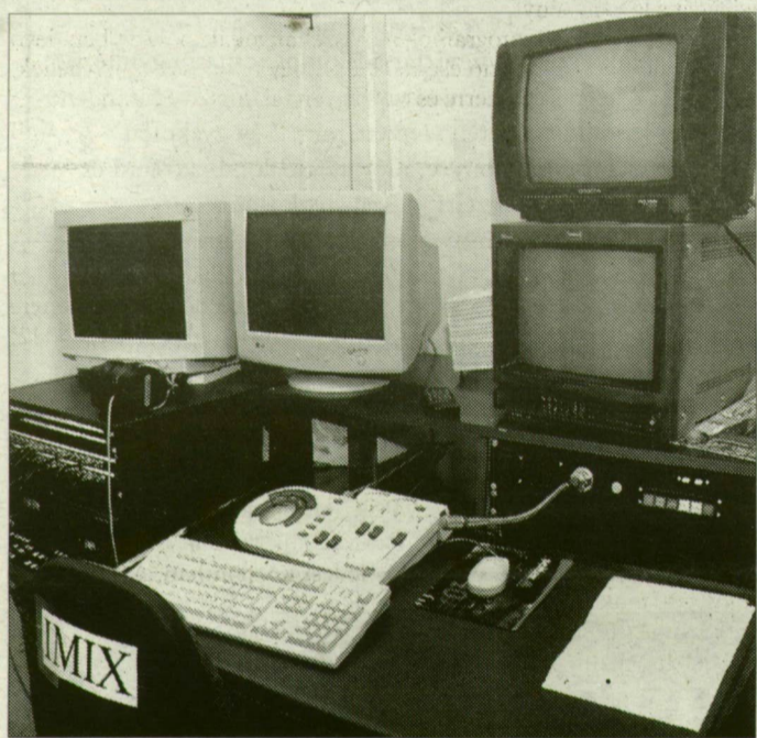
Csendélet a szegedi stúdióban.