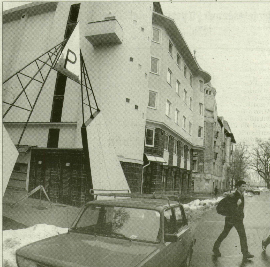
Talán egy hónap múlva már ki lehet próbálni a parkolóházat.

Lapunkban a kezdetektől fogva nyomon követjük az Arany János utcai parkolóház építését. 2002. október 30-án azt írtuk, hogy az automata parkolási technológia szállításának csúszása miatt nem nyitható meg az eredetileg eltervezett júniusi időpont után szeptemberben sem az első szegedi parkolóház. Október végén arról adtunk hírt, hogy a robotizált parkolótechnológia szoftverének telepítése és beüzemeltetése folyik a parkolóházban. Majd néhány nappal később arról számoltunk be, hogy az automatika még igényli az emberi felügyeletet, a Siemens mérnökei ugyanis még csak most (november 4-én – a szerk.) kezdik feléleszteni azt a vezérlő szoftvert, amely a robotot irányítja. December 12-én arról írtunk lapunkban, hogy a parkolórobotokat irányító szoftver még mindig nem működik tökéletesen, a kézi vezérlésű, sikeres próbaüzemet követően ezért nem sikerült november végén átadni az Arany János utcai parkolóházat. Akkor elmondták a szakemberek, hogy néhány napon belül megtörténik a számítógépes program végleges verziójának telepítése, így minden akadály elhárul a nyitás előtt. 2003. január 29-én arról számoltunk be, hogy a szakemberek februárra ígérték a parkolóház megnyitását.