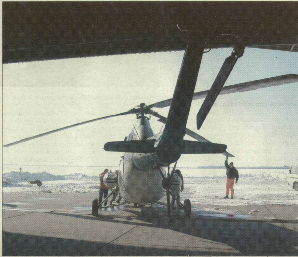
Kilátás a hangárból: a helikopternek nem kell szilárd kifutópálya.