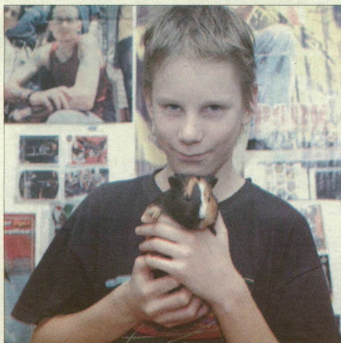
Attila csak rövid ideig képes nyugton maradni.

Attila hiperaktív. Neki a tanulásnál vannak gondjai, a tanároknak meg vele. Lassan már nincs iskola, amelyik befogadja.