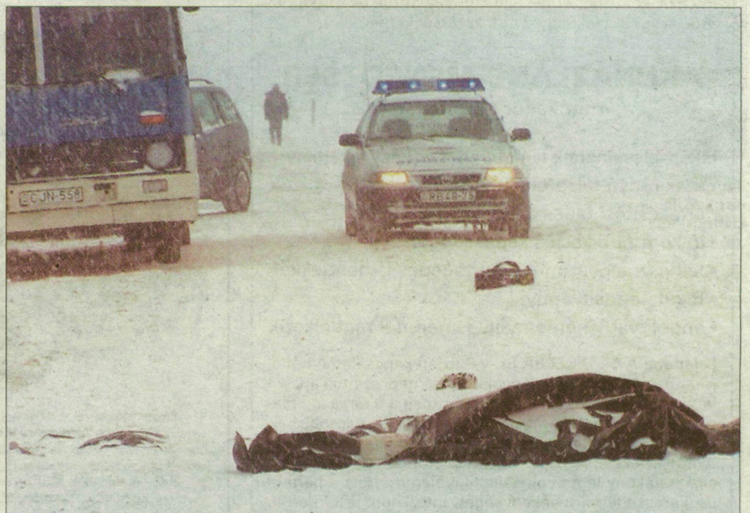
A baleset miatt közel két órán át állt a forgalom a 47-es úton.