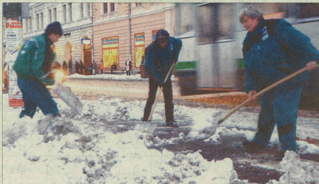
A lapátosok a járdákat takarították, az autósok a hókotrókat hiányolták az utakról.