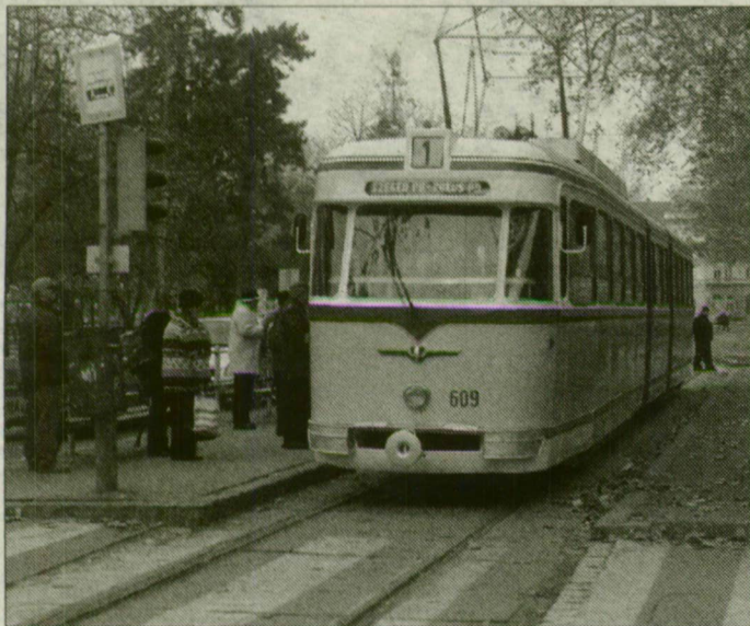
Üdítőital-reklám helyett korhú, sárga színű festés borítja a negyvenéves tuját.