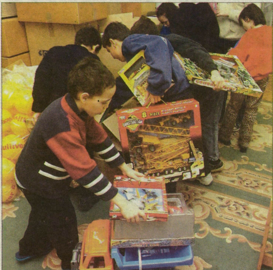
Az otthon kis lakói örömmel bontogatták a játékokkal teli dobozokat.

Katalin-napi bál bevételéből játékokat vettek a gyermekotthonokban élő apróságoknak. A Csongrád megyei intézménybe tegnap érkezett meg a labdákkal, társasjátékokkal, babákkal és sporteszközökkel megrakott kamion.