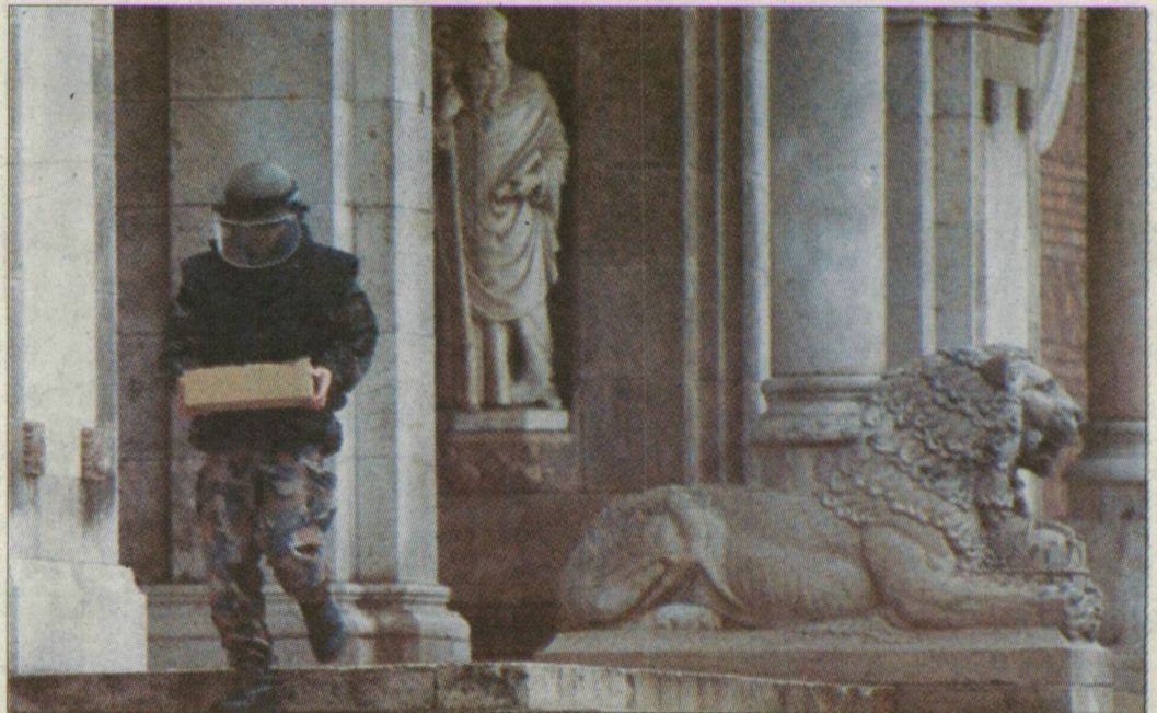
A tűzszerész kézben hozta le a szentély fölött lévő háborús aknát.

A tető felújításán dolgozó munkások szerda délután fedték fel az ácsolat közé ékelődött „furcsa” tárgyat, azonnal abba hagyták a munkát, és jelentették nekem, hogy bombagyánús szerkezet van a templom padlásterében – mondta a plébános. – Az épület a háborúban számos találatot kapott, így nem elképzelhetetlen, hogy tartogat még meglepetést a felújítás. A bombát azonnal jelentettük a honvédségnek. A tűzszerész-járőrök tegnap délután érkeztek meg a Dóm tere, és a rendőrök, valamint a vá-