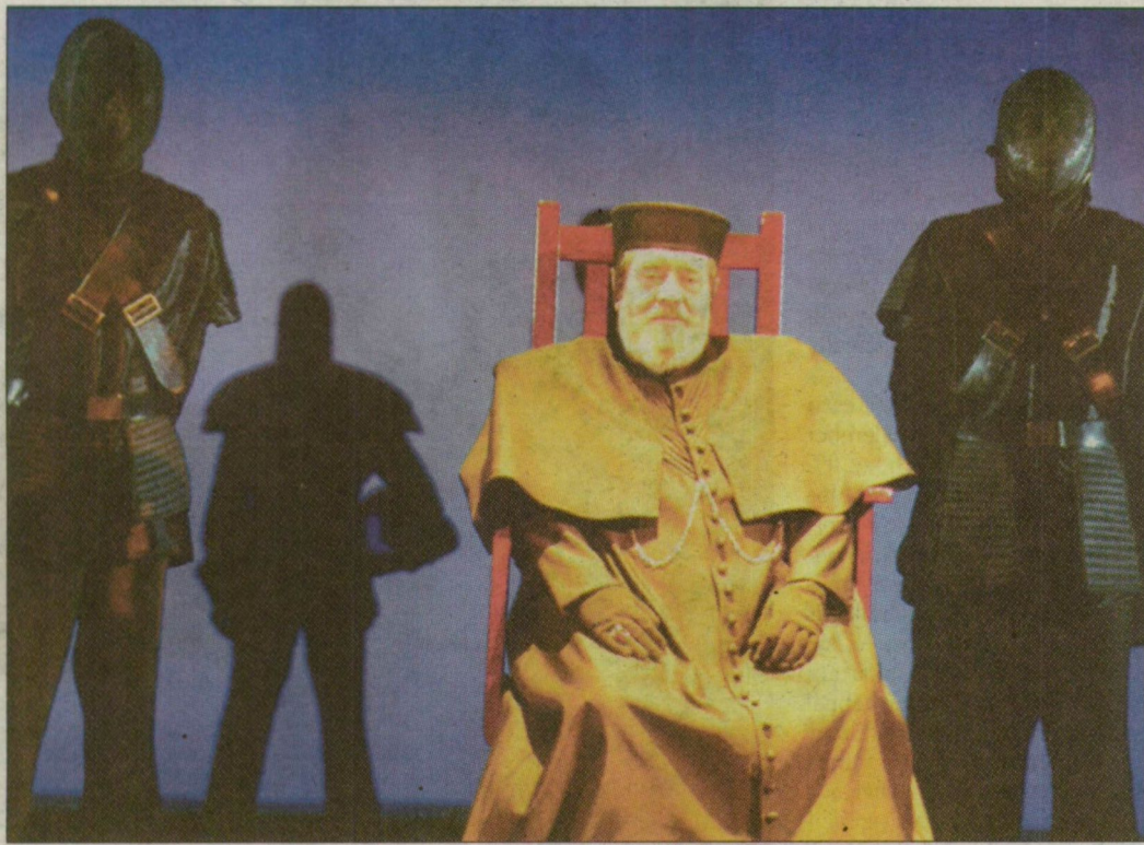
A Szent Johanna bölcspapja a színpadon. Vizsgálják a színházat is.