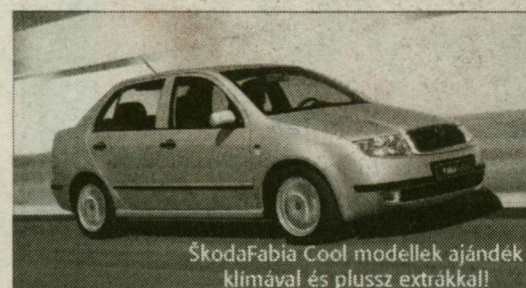
SkodaFabia Cool modellek ajándék klímával és plusz extrákkal!