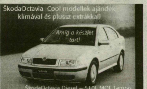
SkodaOctavia Diesel – 510L MOL Tempo Diesel üzemanyaggal ajánlunk!

November 23–24-i nyílt napunkon mindenről személyesen is meggyőződhet egy ingyenes próbaút keretében.