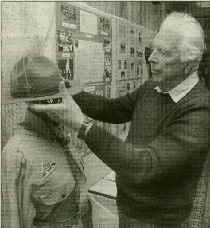
Nagy Mihály világlátásában hűen követte a cserkészélet fontos tanításait.

Bács-Kiskunban is tudnak a szegedi ítéletről