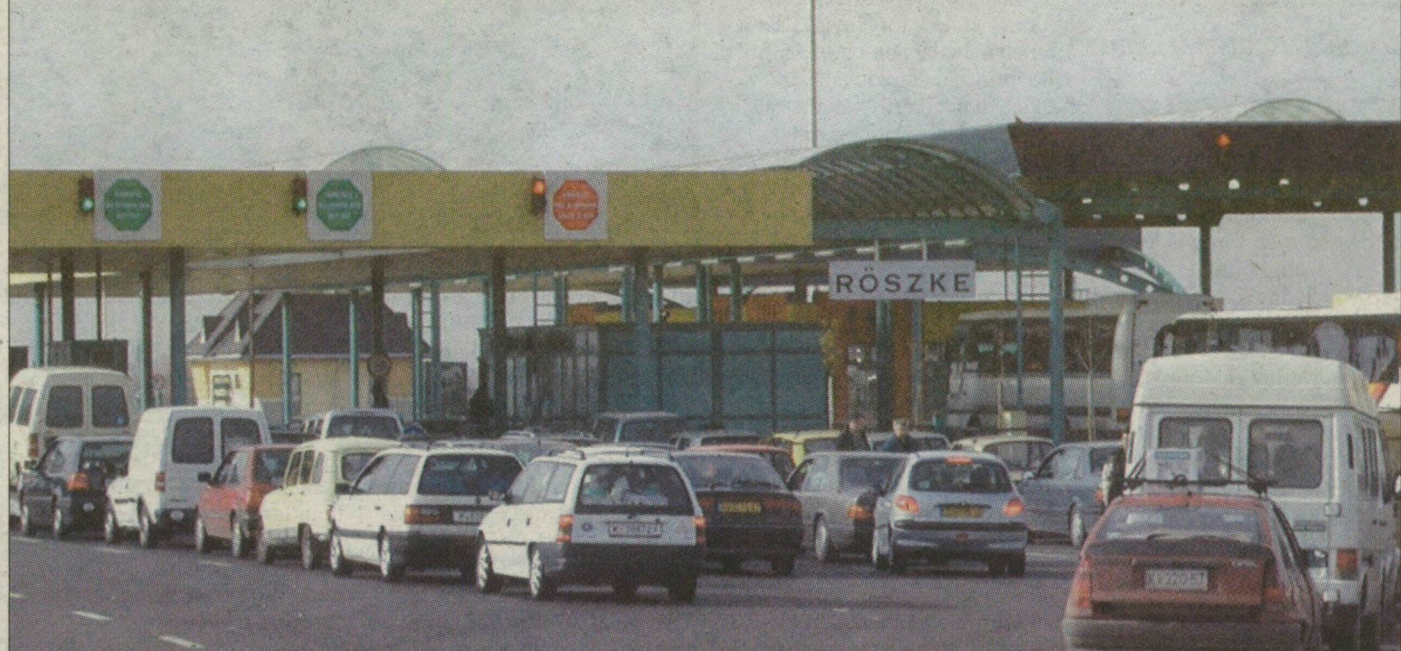
Egyelőre nem kérnek vízumot Röszkénél, ám bő fél év múlva változik a helyzet.

Várhatóan 2003. július elseje után csak vízummal utazhatnak Magyarországra a szomszédos déli-délkeleti országok állampolgárai. Jóllehet hivatalosan még nem nyilatkozott a Külügyminisztérium illetékese lapunknak, szinte bizonyosra vehető, hogy 2003. július 1-jét követően a szomszédos déli-délkeleti