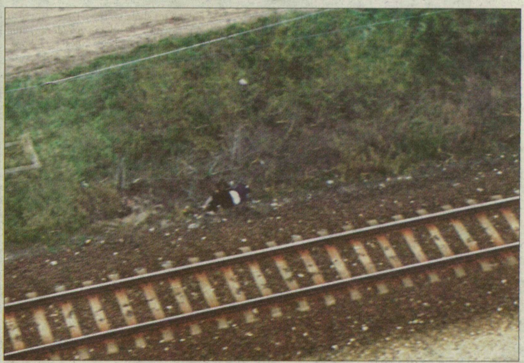
A csengelei vasútállomástól két kilométerre, a vasúti töltés aljában találták meg azt a nénit, aki hétfő este tűnt el a Budapestről Szegedre tartó vonatról. Bővebben a 3. oldalon.