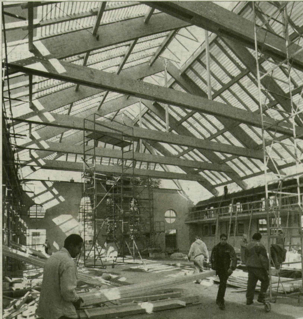
Belső munkák a Radnóti épülő tornacsarnokában.