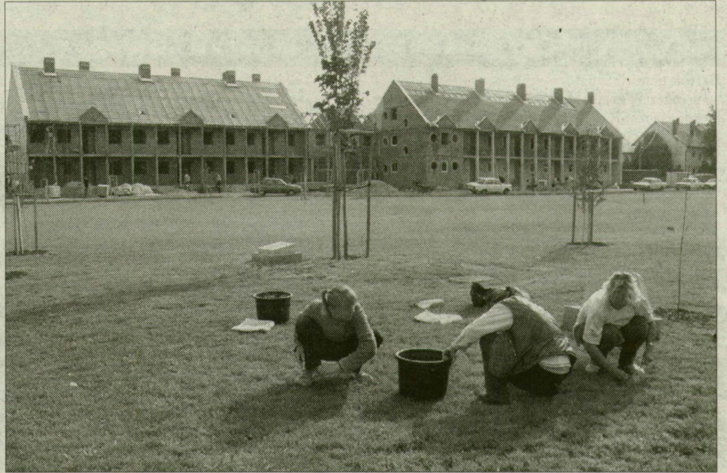
Hamarosan elkészülnek a településen az új, önkormányzati bérlakások.