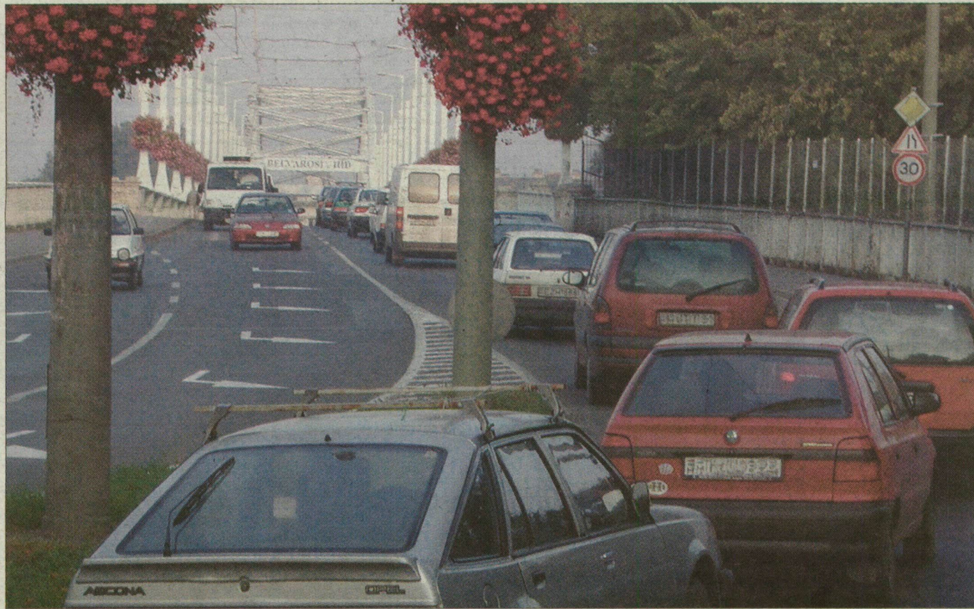
Csúcsidőben nagyon föltorlódik a forgalom a szegedi Belvárosi hídon.

A növekvő gépjárműforgalom és a rosszul beállított közlekedési lámpák miatt csúcsidőben csak lépésben lehet átmenni a szegedi Belvárosi hídon.