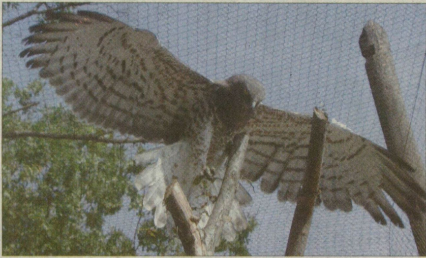
A kígyászölyvet tágas otthonában figyelhetik meg a látogatók.

A park legnagyobb ragadozó madara, a szirti sas is új otthonra talált. – A határon elkobzott tojót két hónapja hozták