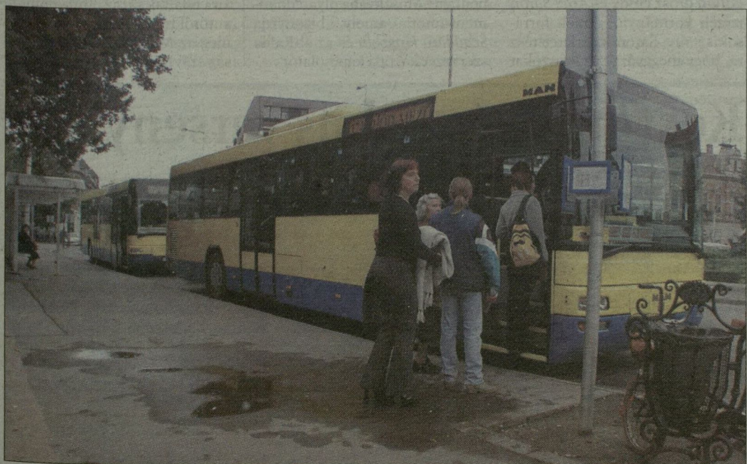
A Hód-Mező napközben néha két autóbust is indít egy időben a sok utas miatt.