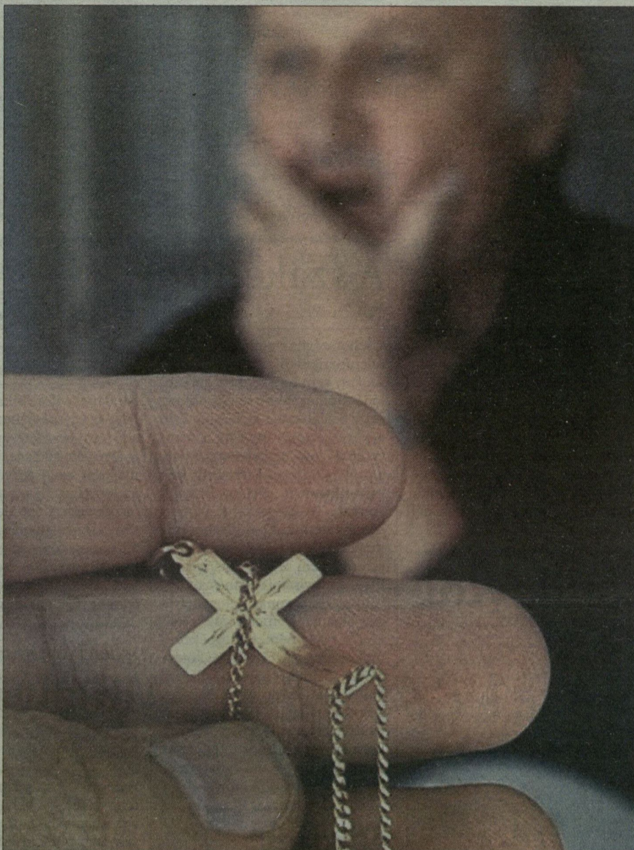
Az áldozat keresztje és fia.