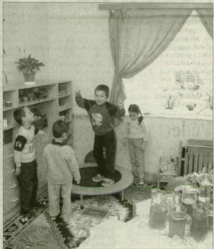
A megújult óvoda a gyerekek tetszését is elnyerte.

Felújították és hivatalosan is átadták a Kiskundorozsmai Óvodai Körzet Széksősi úti tagóvodájának épületét.