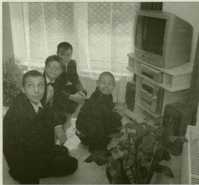
A gyerekek ismerkednek az új környezettel.