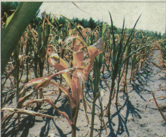
A kukorica már nem „emlékszik” az aszályra.

A kormányzat gyors intézkedést ígér az aszálykárok enyhítésére, ám ehhez pontos adatokra van szüksége.