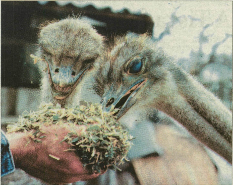
Hasznos, de nem étvágytalan madarak.

Változott a nagy testű futómadár besorolása. A korábban tenyésztett vadként nyilvánított strucc most már gazdasági haszonállatnak minősül. Emiatt több és szigorúbb szabályokat kell betartaniuk a tenyésztőknek, ha piacképesek akarnak maradni. A változásra azért volt szükség, mert az unióban