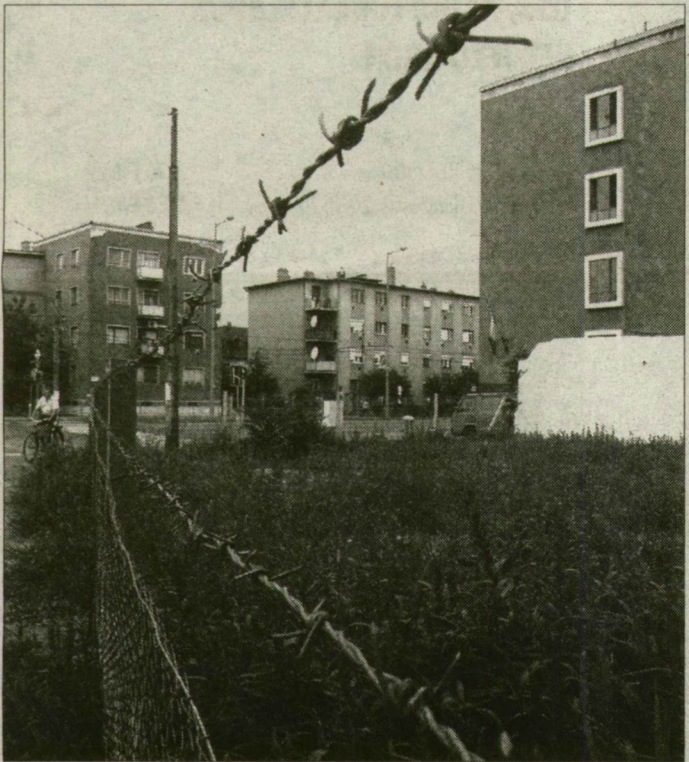
Lehet, hogy eladják a telket.