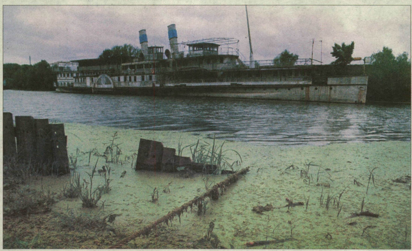
Egy befektető már építési engedélyt is szerzett a Szőke Tisza fölújítására.