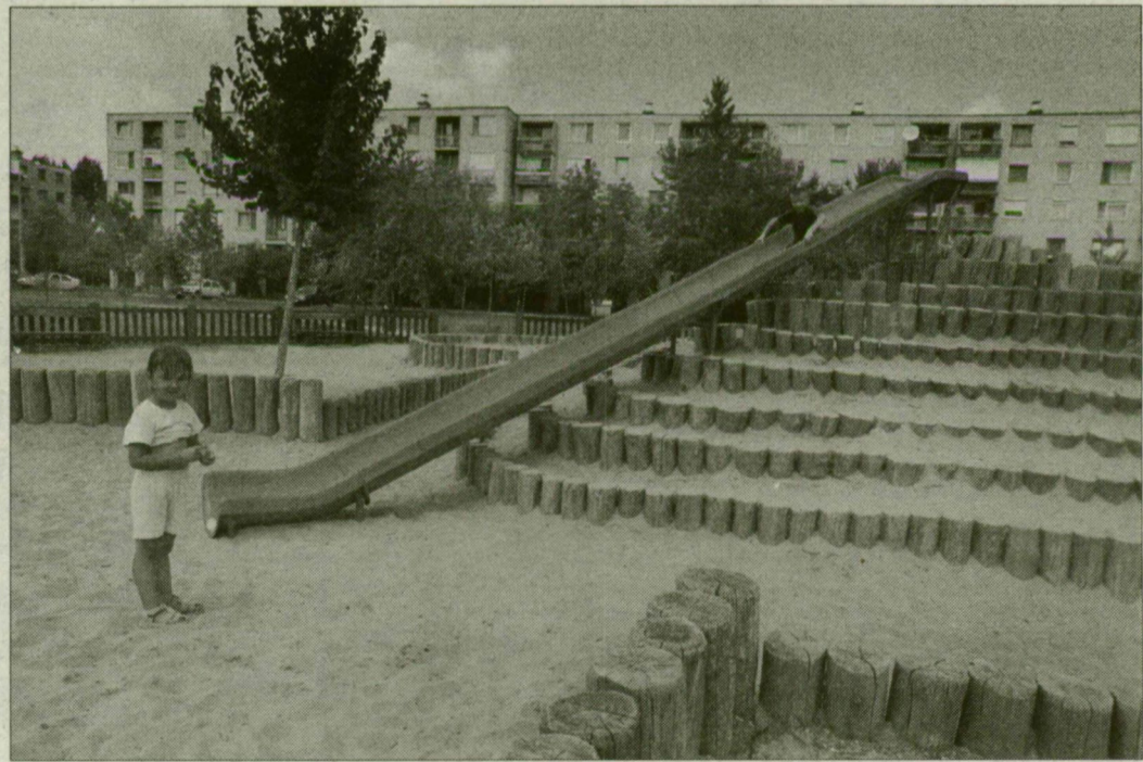
A Honfoglalás játszótér a makkosházi gyerekek egyik kedvelt helye.