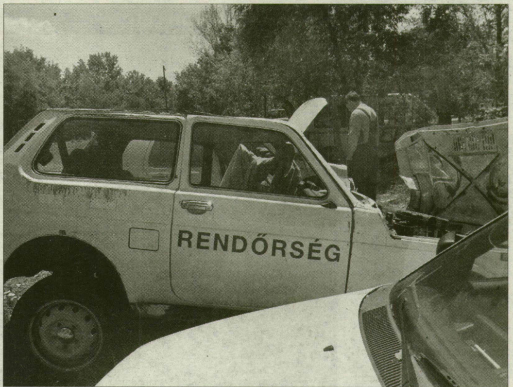
A jobb állapotú, olcsóbb autókért gyakran lendültek magasba a tárcsák.

Lada Nivára már 200 ezer forinttól lehetett licitálni. – Megveszi a kereskedő, kipofozza, té-