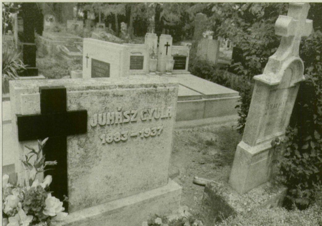
Aki keres, megtalálhatja Juhász Gyula sírját is.