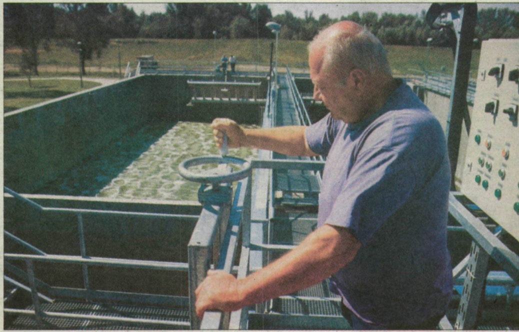
A makói tisztító képes befogadni a környező községek szennyvizét is.

Az új, egymilliárd forintot érő biológiai tisztító alkalmas a foszfát és a nitrát eltávolítására is, és a tisztítás alkalmazkodik a beérkező szennyvíz összetételéhez. Ez azért számít jelentős lépésnek Makón, mert a régi, mechanikai rendszerű tisztító nagyon sok szennyeződéssel átengedett. A városban több üzem elkészítette előtisztítóját is. Most kezdődött a Földeáki út melletti Sole Tejüzem berendezésének próbaüzeme is. Ez azt jelenti, hogy a cég immár