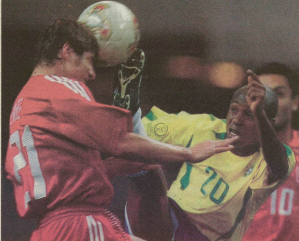
A foci-vb második elődöntőjében ádáz csatában 1-0-ra nyertek a brazilok a törökök ellen. Így a német és a brazil csapat játssza vasárnap a döntőt.