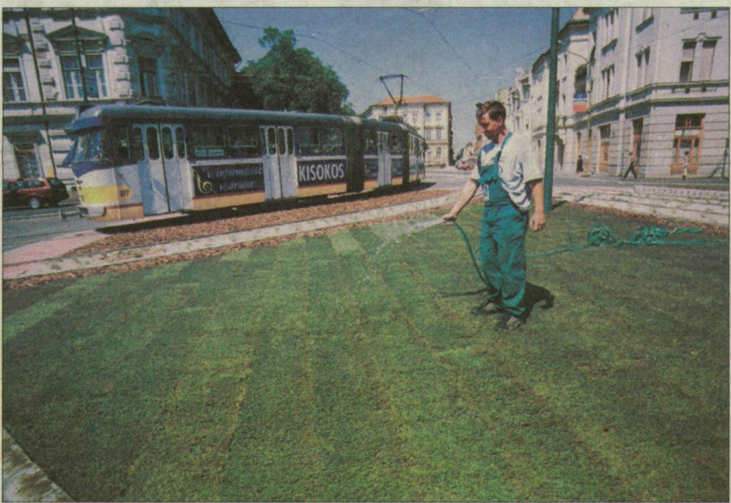
Átadás előtti utolsó simítások. Locsolják az új gyepszőnyeget.