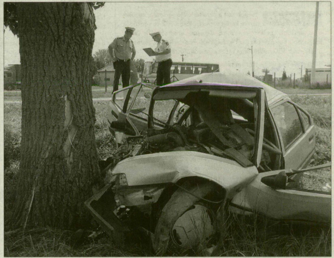
A totálkáros autó sofőre csak kisebb sérüléseket szenvedett.