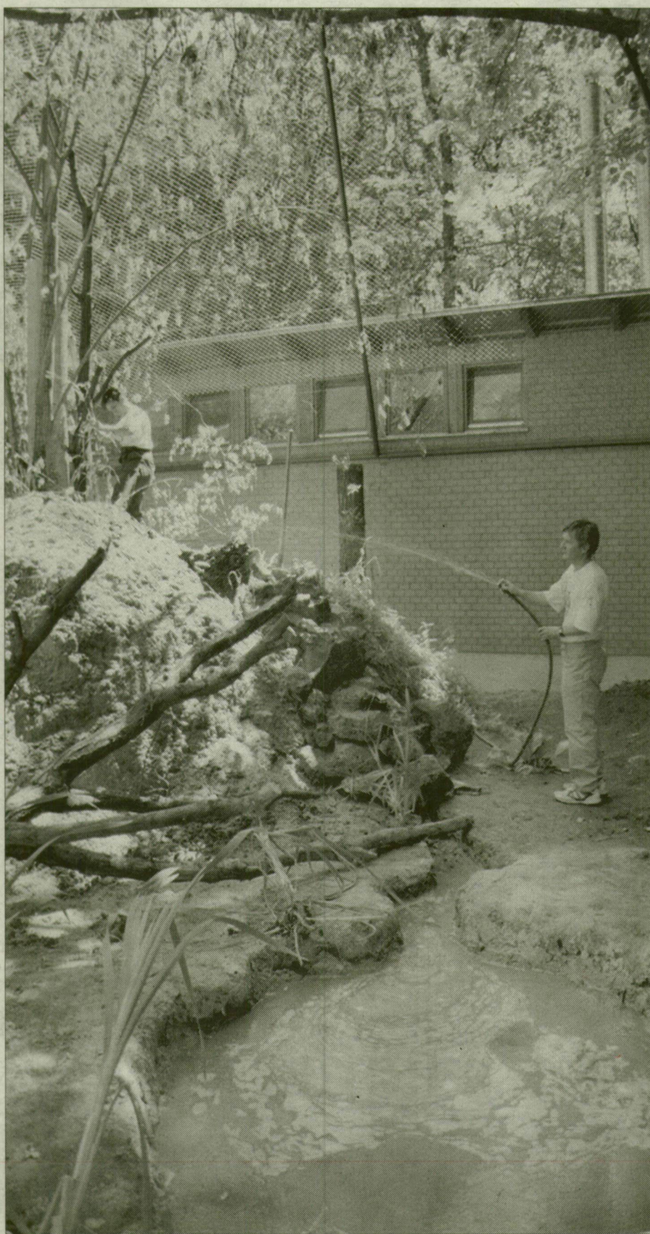
K. T. A szegei papagájropde már megfelel az európai elvárásoknak.

Az állatkertekkel foglalkozó törvény mellett a KvVM más rendelet módosítását is indítványozza. Így többek között az állatmenhelyek finanszírozási feltételeinek javítását, hiszen a miniszter szerint mintegy 3 millió állat kóborol Magyarországon. Ezen kívül be akarják tiltatni a cápashow-kat és delfináriumokat, illetve a kóbor állatokon folytatott kísérleteket, de szabályozni kívánják az élő állatok szállítását és a díszállat-kereskedések működését is.