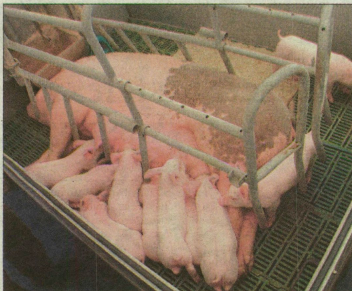
Ők már nagyobb támogatással mehetnek exportra.