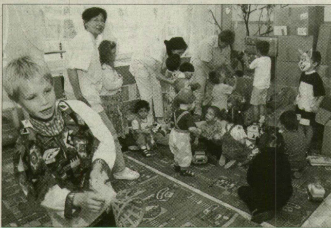
Igazán öröm ajándékot kapni.