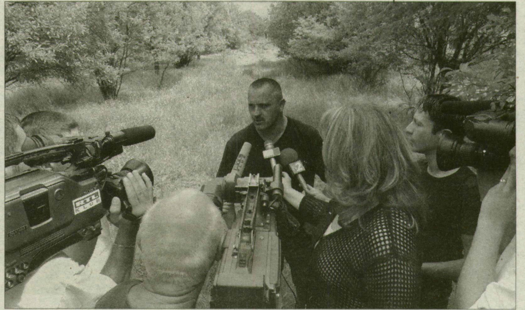
Kumbor Tibor alezredes tájékoztatta a sajtó képviselőit a nyomozás állásáról.